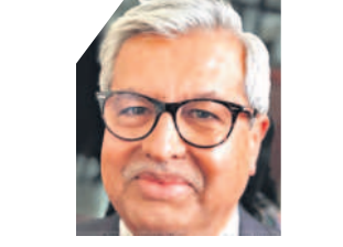
దువ్వంత్ దేవ్ (సుప్రీంకోర్టు సీనియర్ న్యాయవాది)

ప్రతిపక్ష పార్టీలు లేని దేశమే బీజేపీ లక్ష్యం. అందుకే ఈడీ, సీబీఐ వంటి కేంద్ర దర్యాప్తు సంస్థలతో ప్రతిపక్ష పార్టీ నేతలను వెధంపులకు గురిచేస్తున్నది. బహుశా పార్టీ వ్యవస్థ అనేది రాజ్యాంగం ప్రాథమిక లక్షణం. కేంద్ర దర్యాప్తు సంస్థల సాయంతో దాన్ని నాశనం చేయవద్దు. ప్రస్తుతం దేశంలో అన్ని రాజ్యాంగబద్ధ సంస్థలు సహజమైన ఎదుర్కొంటున్నాయి.